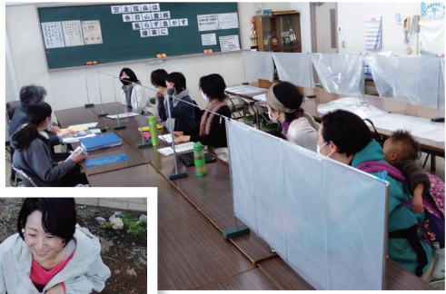
「日高の学校給食を考える会」の仲間と、給食をよくするために活動しています。