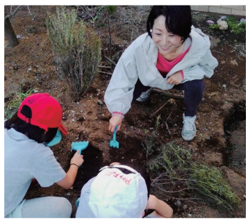
子どもたちと遊び学びながら、PTA 連合会長として活動資金の捻出に力を入れました。