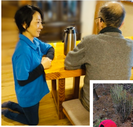
介護福祉士・生活相談員として、丁寧に話を聴くことを大切にしてきました。